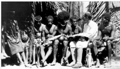
El antropólogo Bronislaw Malinowski (1884-1942), con los indios de las islas Trobriand, parte del archipiélago melanesio de Papúa-Nueva Guinea