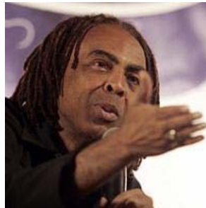
Gilberto Gil. ampliar

A nivel global nos encontramos, según Gil, ante una de las batallas "políticas, económicas y de la vida social" más "interesantes y actuales". "Hay varias revoluciones por hacer", afirma, y puede parecer un discurso del siglo XIX, pero es que en el mundo de hoy en día también nos encontramos con "realidades del siglo XIX". Y para afrontarlas no se puede seguir separando el mundo digital del analógico, porque según el ministro brasileño en todos los foros internacionales todos los debates convergen: "derechos de autor, patentes, desempleo, acceso al conocimiento, diversidad cultural, privacidad, seguridad.