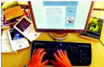
En la red Un joven lee en internet el último libro de Harry Potter, ayer en Madrid.

• La industria editorial asegura que el formato tradicional está demasiado arraigado en los lectores y que las versiones piratas de Harry Potter son un fenómeno puntual